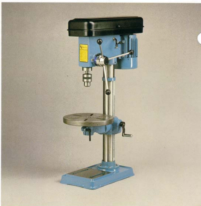
Type 16AE & AT (1x230 el. 3x380V)