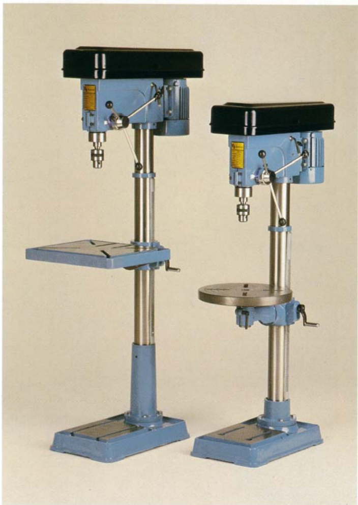
Type 16AF + 25A