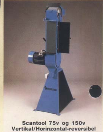
Scantool 75v og 150v Vertikal/Horizontal-reversibel

SCANTOOL båndslibemaskiner med udsugning er specielt for værksteder og fabrikker, som ingen centraludsugning har, eller hvor centraludsugning er langt fra slibestedet. Denne vel nok markedets mest effektive og kraftigste dobbeltsugning er helt skjult i søjlen og er derfor ikke til gene under slibningen.