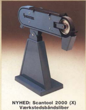
NYHED: Scantool 2000 (X) Værkstedsbåndsliber